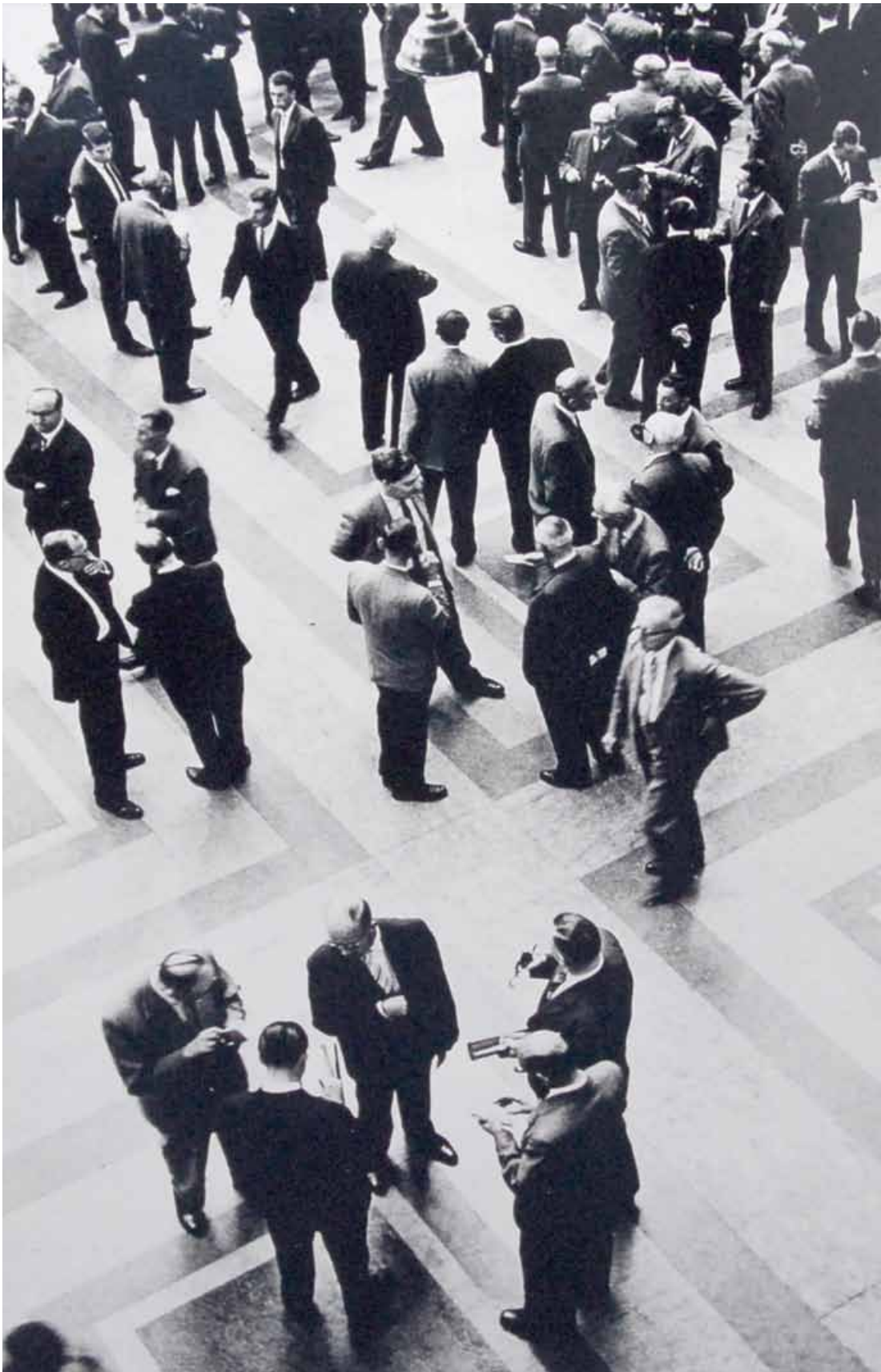
Amsterdamse Effectenbeurs, jaren '60 vorige eeuw