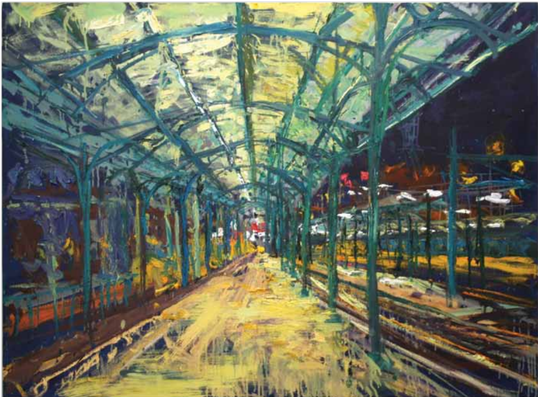
"Perron 1 Groningen", Gertjan Scholte-Albers, olieverf op doek, 2006