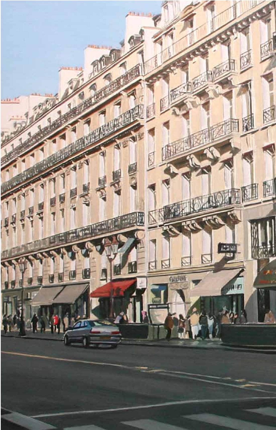
"Boulevard de l'Opera", Roel van Daal, olieverf op doek, 2009