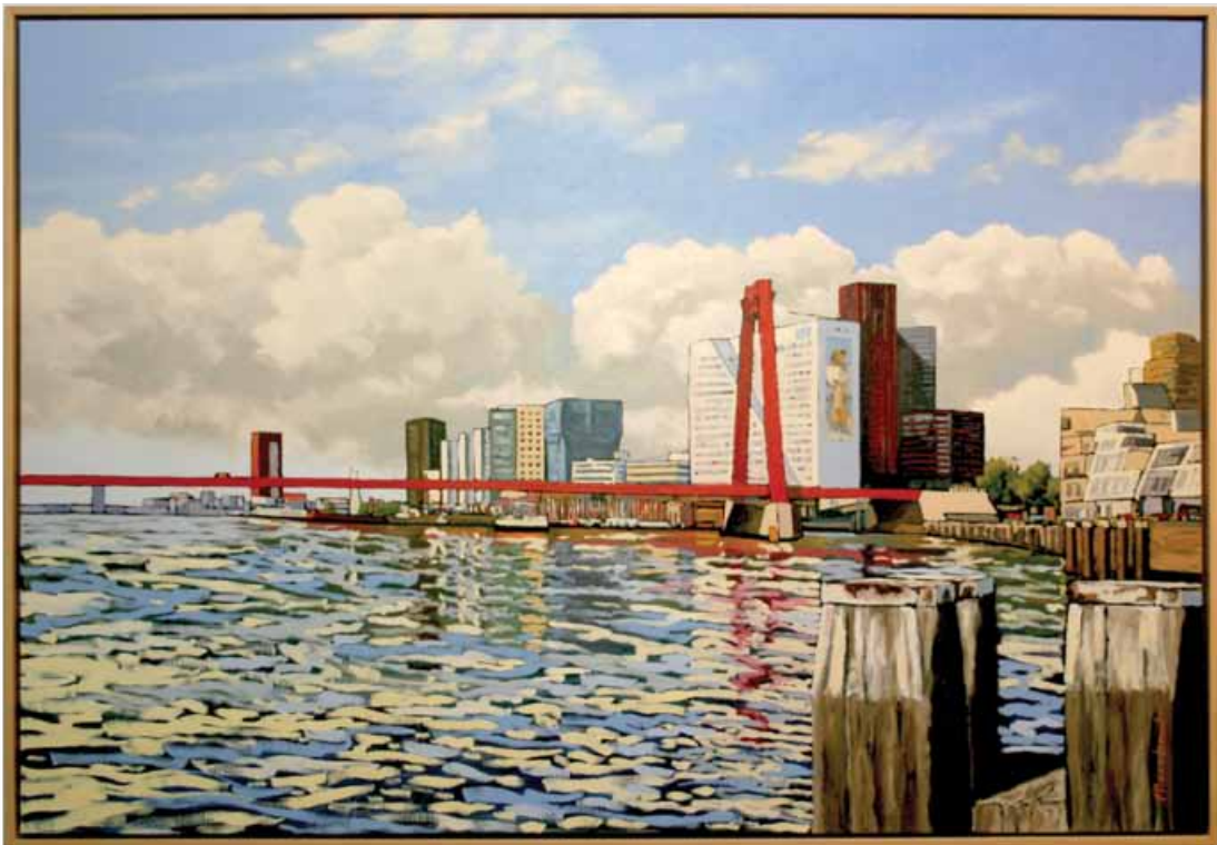
"Willemsbrug", Margot Maaskant, olieverf